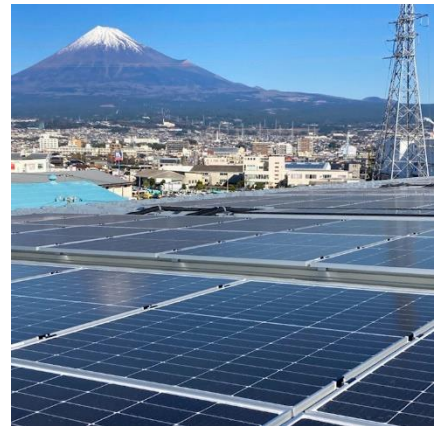
(エコネコル富士工場屋根)

2023年6月時点で、エンビプログループ全体で使用する再生可能エネルギー電力の割合は約87%と、2050年までの目標に向けて着実にRE100への取り組みを進めています。